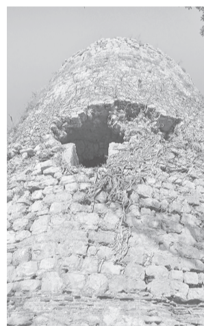
В Анакопийской крепости