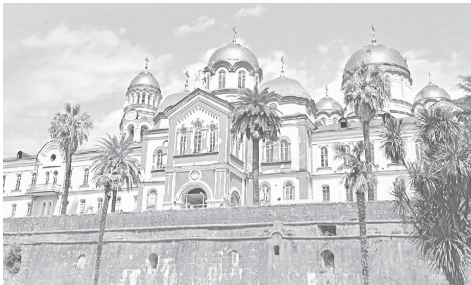
Ново-Афонский Симоно-Кананитский монастырь