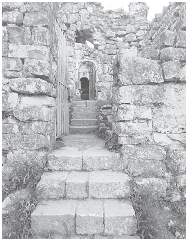
Вход в Иверскую часовню

Абхазия, Новый Афон притягивают к себе с невероятной силой. Хочется вернуться на эту благодатную землю, чтобы увидеть новые исторические и архитектурные достопримечательности и природные красоты, дарующие покой и отдохновение.