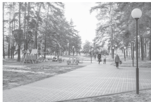
«Экопарк» в пос. Красный Бор

Из 37 объектов сданы 36. Завершаются работы по благоустройству двора в деревне Кузнециха.