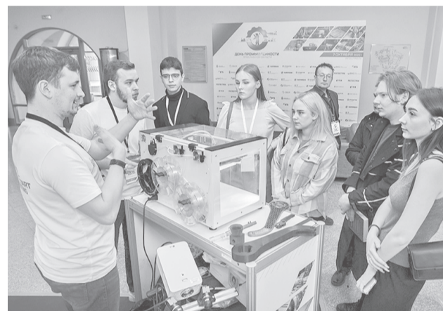
Будущее региона – в руках молодых

Для поддержки промышленности в регионе работает антитеррористический штаб во главе с губернатором, реализуется план первоочередных мер по обеспечению устойчивого развития экономики. На 200 млн рублей в условиях санкций реализуются докапитализированный Фонд регионального развития и Фонд поддержки малого и среднего предпринимательства, где предприятия получают займы по низким ставкам 1-5 процентов как на оборотные, так и на инвестиционные цели. К настоящему времени бизнесу выданы антикризисные займы более чем на 260 млн рублей. Общая сумма поддержки от двух фондов за 8 месяцев 2022 года составила 750 млн рублей. Кроме того, за последний год был значительно расширен список системообразующих предприятий региона: с 11 до 38. Это открыло для 27 промышленных компаний Ярославской области новые возможности в получении льготного финансирования и обеспечении их федеральной поддержкой.