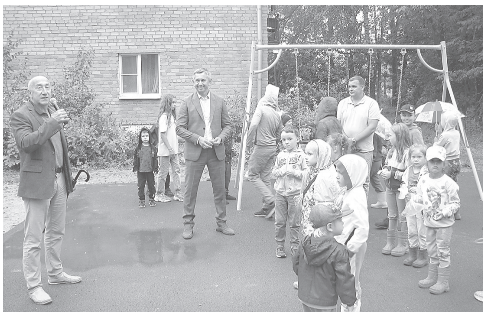
Открытие детской площадки в пос. Михайловский

■ с. Спас-Виталий, обустройство хоккейного корта.