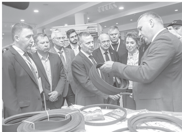
Губернатор М.Я. Евраев (в центре) посетил День промышленности Ярославской области

В Ярославле 7 октября прошел День промышленности, организованный правительством региона, департаментом инвестиций, промышленности и внешнеэкономической деятельности и областной Торгово-промышленной палатой.